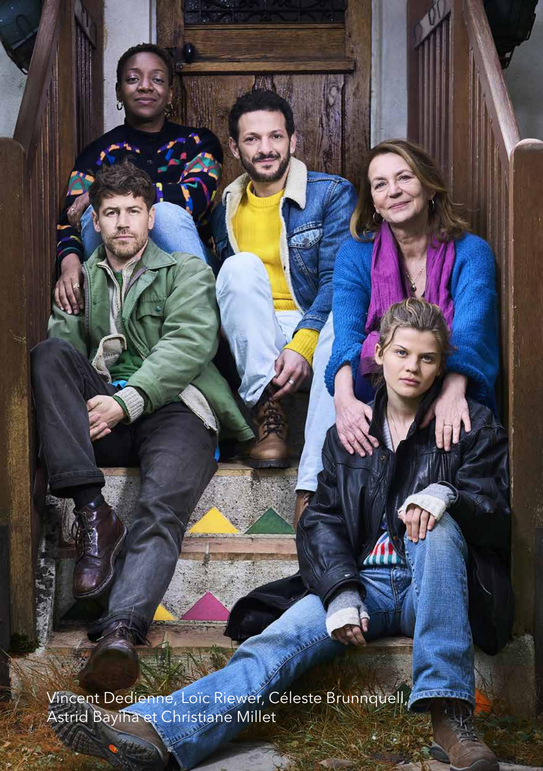
Vincent Dedienne, Loïc Riewer, Céleste Brunnquell, Astrid Bayiña et Christiane Millet