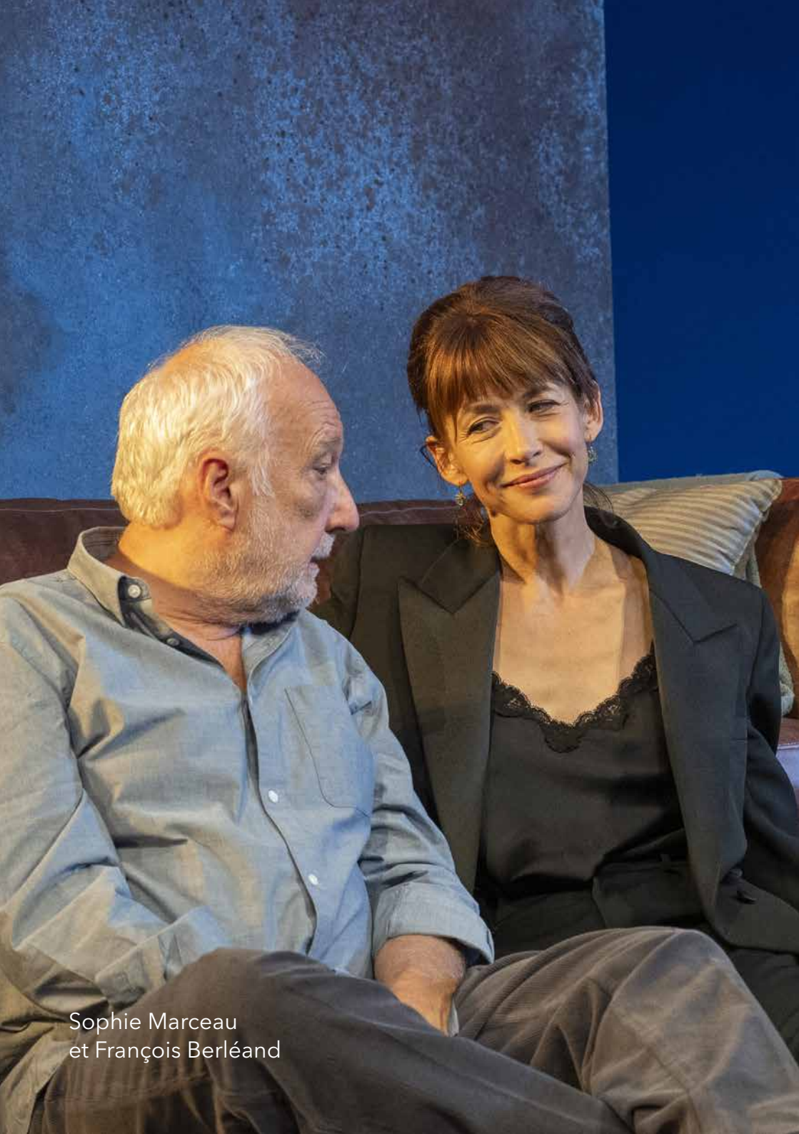
Sophie Marceau et François Berléand